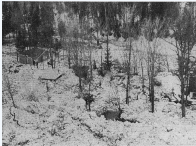
sur la rivière Montmorency, près de Sainte-Brigitte-de-Laval, n'avait rien d'enchanté hier. Maisons, chalets et cabanes, tout était envahi et même empo